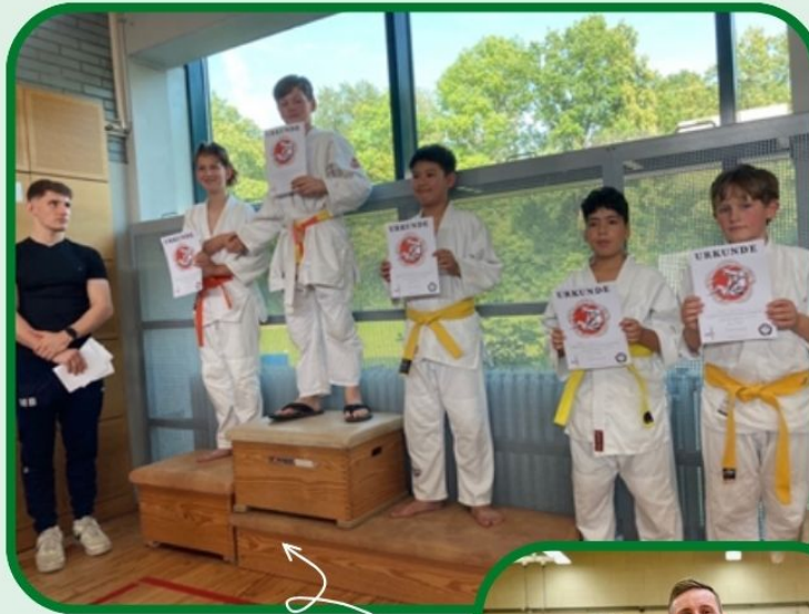
Valerian mal ganz oben: Kreismeister Mayars erste Bronzemedaille